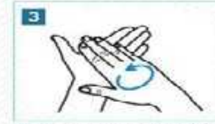
3 Sabunu avuç içimizde iyice köpürelim