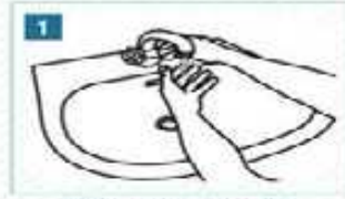
1 Ellerimizi suyla ıslatalım