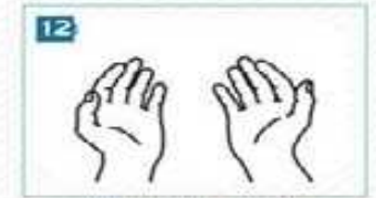
12 Ellerimiz artık tertemiz...