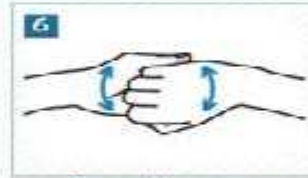
6 Parmaklarımızı kenetleyip ovalayalım