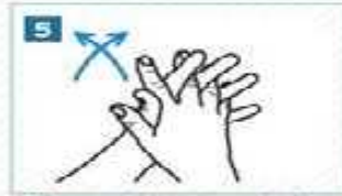
5 Parmaklarımızı iç içe geçirip ovalayalım