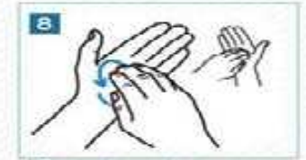
8 Parmak uçlarını avuç içimizde ovalayalım