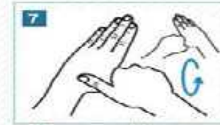
7 Başparmaklarımızı ovalayalım