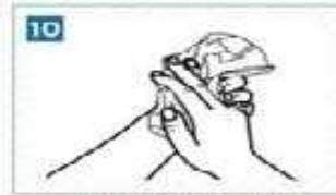
10 Kağıt havluyla kurulayalım