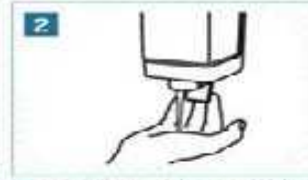
2 Yeterince sabun alalım