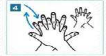
4 Sol elin üstünü sağ elle, sağ elin üstünü sol elle ovalayalım