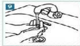
9 Ellerimizi bol suyla durulayalım